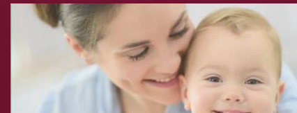
Partnerships in Consumer Health