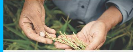
Grants4Targets Crop Science