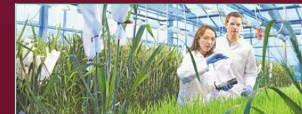
Partnerships in Crop Science